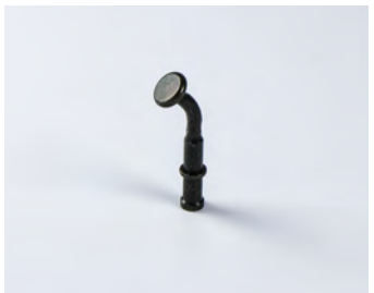
BOLZEN IM GEPÄCK- RAUMMANAGEMENT