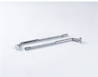
HAKEN IM GEPÄCK- RAUMMANAGEMENT