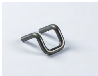
ISO FIX BÜGEL