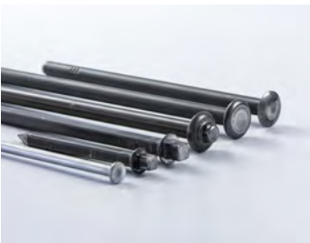
BOLZEN UND SCHRAUBEN FÜR DIE BAUINDUSTRIE