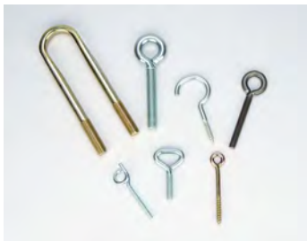
BOLZEN MIT VER- SCHIEDENEN KÖPFEN