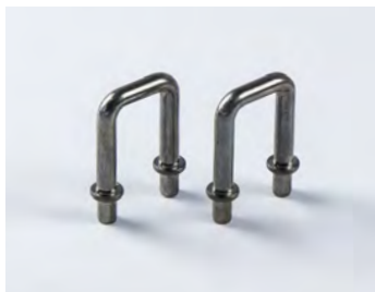
ISO FIX BÜGEL