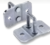
BAUGRUPPEN UND MONTAGE