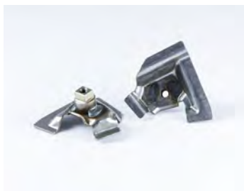
SCHWEISSBAUGRUPPE IM PKW-SITZ