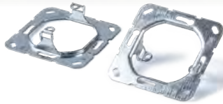
STANZ- UND STANZ- BIEGETEILE